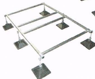
StrutFoot 4 system