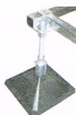
StrutFoot Complete Leg Assembly