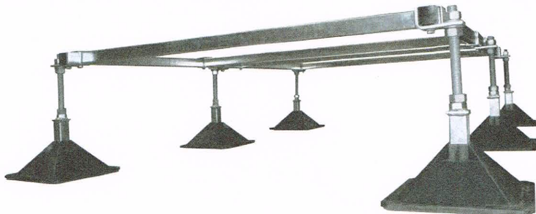
StrutFoot 4 system shown