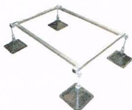
StrutFoot 2 system