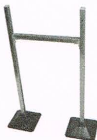
Kit Soporte H Complete with Unistrut