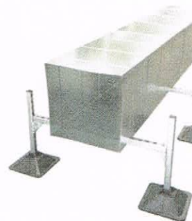
Marco H Soporte Kit (x2) Ej: Instalaciones de conductos